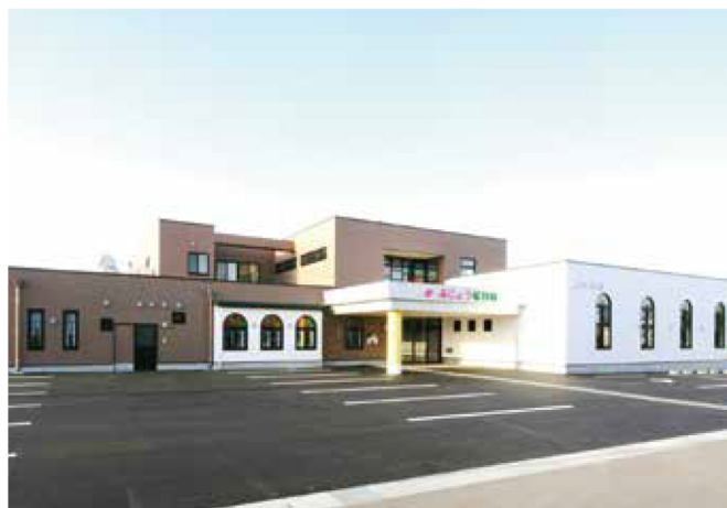
ぶじょう保育園(官庁工事)