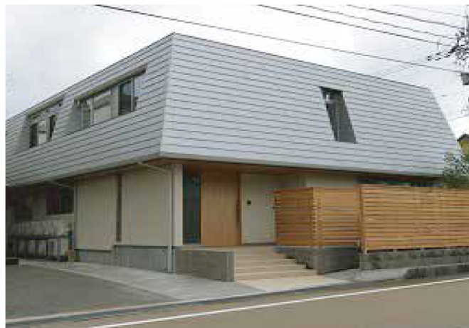
障がい者グループホーム どんぐりの杜(民間工事)