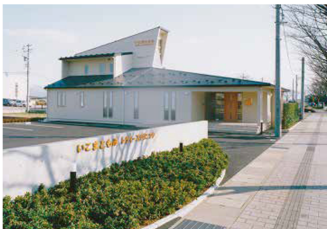
いこまともみレディースクリニック(民間工事)