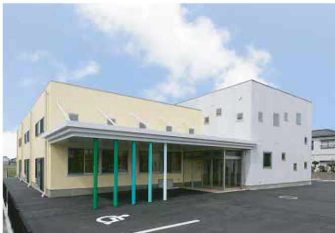
あいのき児童センター(官庁工事)

鉄骨構造に用いられる鋼材は木や鉄筋に比べて非常に強度が高い素材です。鋼材は耐久度が高いためスパン（柱と柱の間）を大きくとることができ、大きな開口や柱のない広々とした空間が必要な店舗や事務所に良く使われます。また、鉄骨構造は、建物の構造体と内部の間仕切りがそれぞれ独立しているため、建築後に時代や流行の変化に合わせて大規模な間取り変更が可能です。高い耐久性を活かし、リフォームを繰り返すことで、長期間機能する『資産』となります。