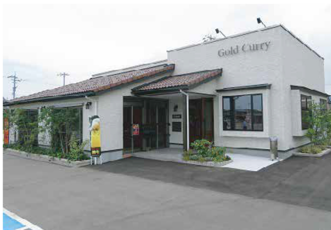
フランス料理店ヴォワ・ラクテ(店舗建築)